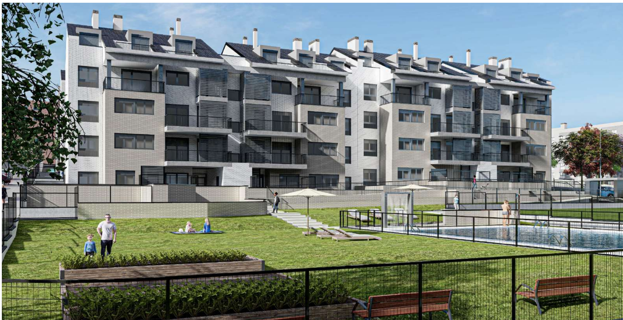
Urbanización y Zonas Comunes