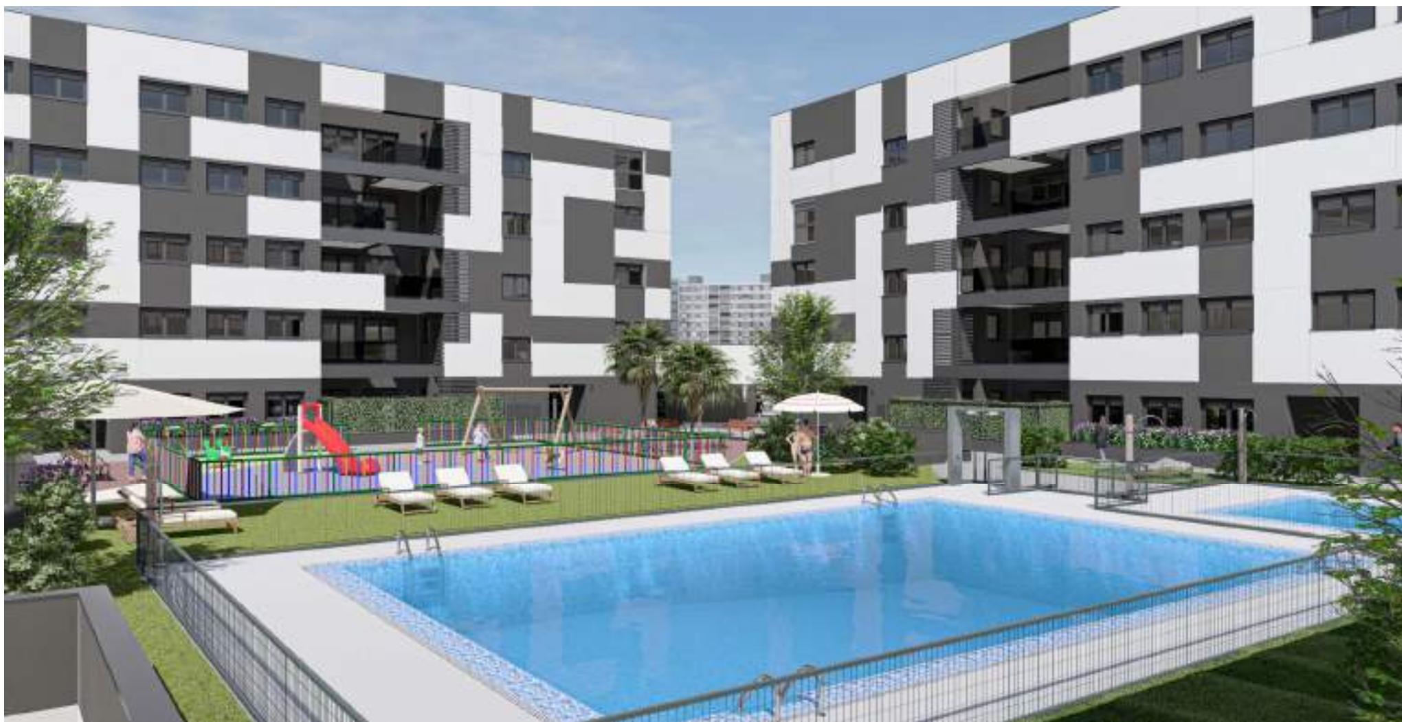
Urbanización y Zonas Comunes