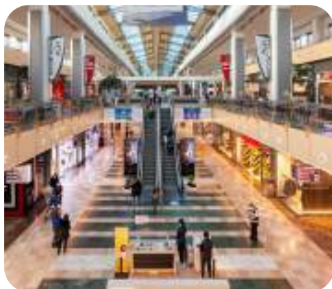
Centro Comercial La Gavia