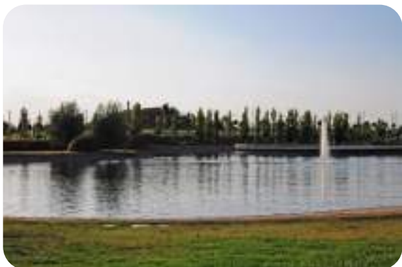
Parque Forestal Valdebernardo