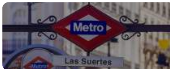
Metro: Las Suertes