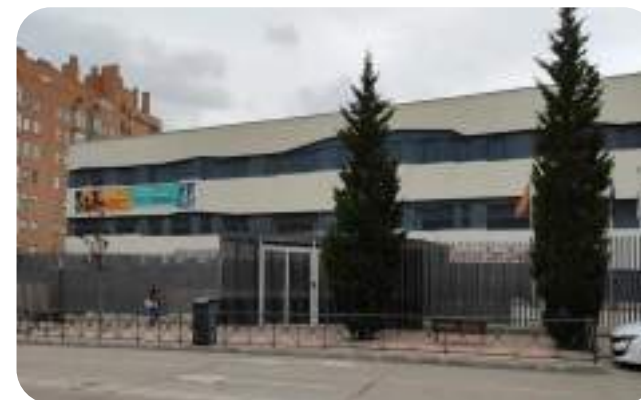
Colegio Bilingüe GSD Las Suertes