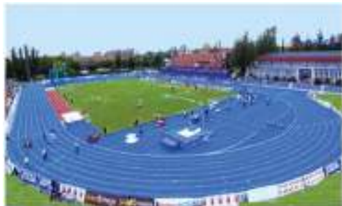
Centro Deportivo Municipal Moratalaz