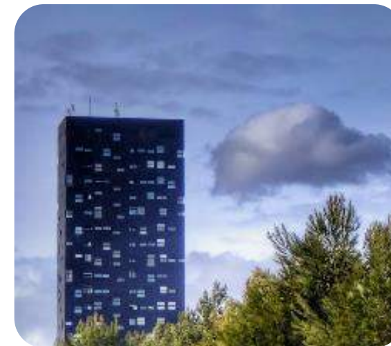
Ensanche de Vallecas