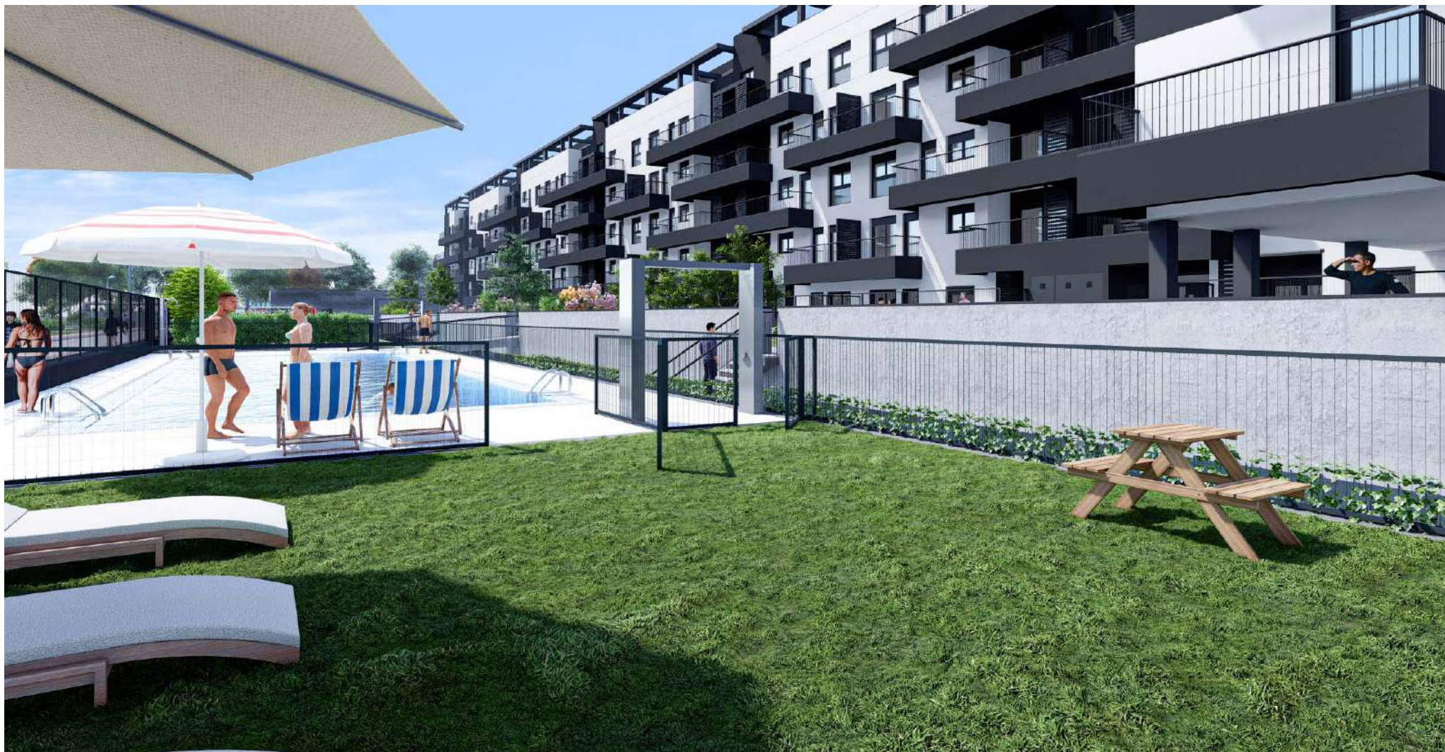
Urbanización y Zonas Comunes